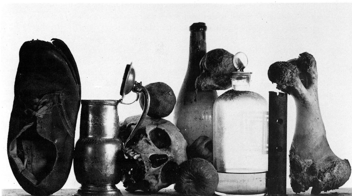
Irving Penn. Still Life with Shoe. 1980.

Com este desabamento total, esta implosão radical da diferença, entramos no mundo do simulacro. Um mundo em que, à semelhança da caverna de Platão, nos é negada a possibilidade de diferenciar a realidade da fantasia, o que é a própria essência do simulacro. Gilles Deleuze, quando analisa no seu livro La Logique du Sens (A Lógica do Sentido) o temor que o simulacro despertava em Platão, argumenta que o próprio trabalho da divisão, bem como a questão de saber como se deve aplicá-la, caracteriza o conjunto do projeto filosófico de Platão. Para ele, a divisão não é uma questão de classificação nem de repartição correta dos diversos objetos do mundo real em gêneros ou espécies, por exemplo.